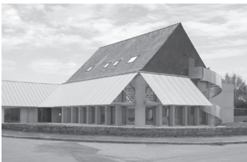
La mairie - salle polyvalente en 2026