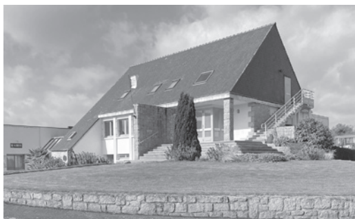
La mairie - salle polyvalente avant 2023

Les travaux de restructuration de la mairie et de la salle des fêtes ont débuté au printemps 2023 et viennent de se terminer.